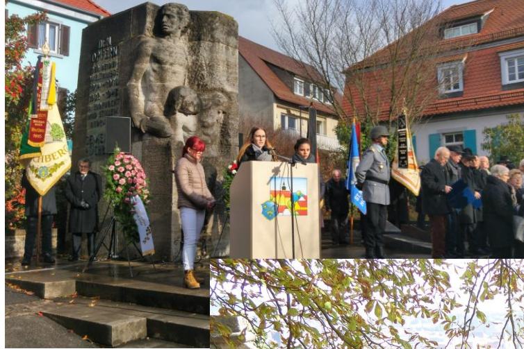
Mitwirkung beim Volkstrauertag am 19.11.2017